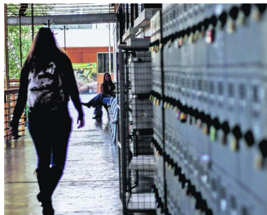
Las universidades se encuentran concluyendo sus procesos de matrícula.

Ignacia Canales 20 OCT 2021 08:38 PM Tiempo de lectura: 4 minutos