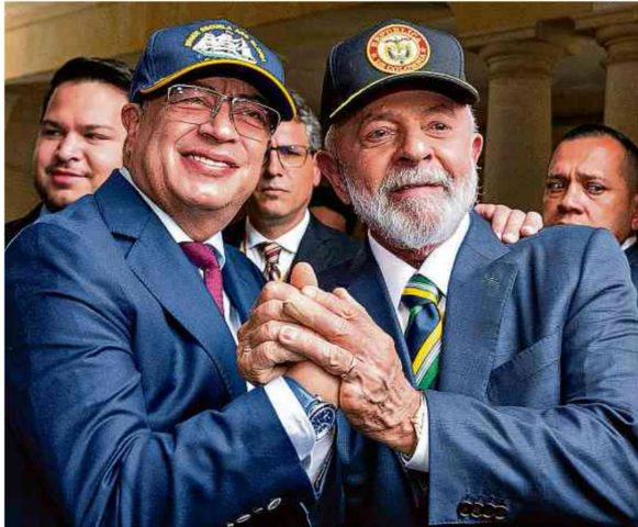
Los presidentes Gustavo Petro (l) y Luiz Inácio Lula da Silva estrechan manos a la llegada del jefe de Estado brasileño a Palacio. Es el cuarto encuentro oficial entre ambos y el 1º en Bogotá.

Los gobiernos de Brasil y Colombia firman seis documentos, incluidos cuatro memorandos de entendimiento, durante la primera visita a Bogotá del presidente Lula da Silva en la administración Petro. Colombia / 1.2